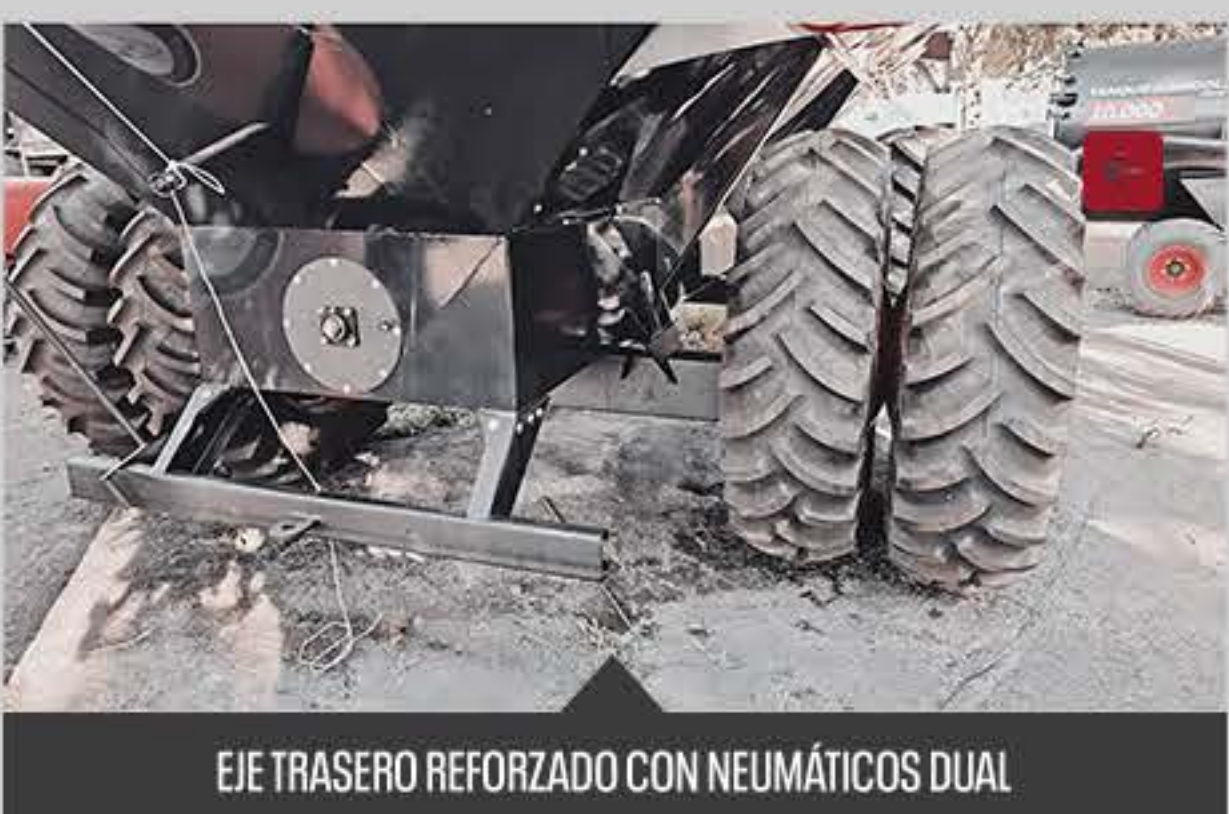
EJE TRASERO REFORZADO CON NEUMÁTICOS DUAL