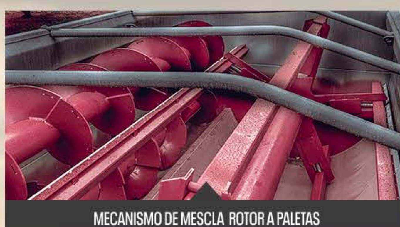
MECANISMO DE MEZCLA ROTOR A PALETAS