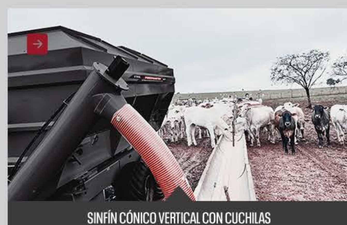
SINFÍN CÓNICO VERTICAL CON CUCHILAS