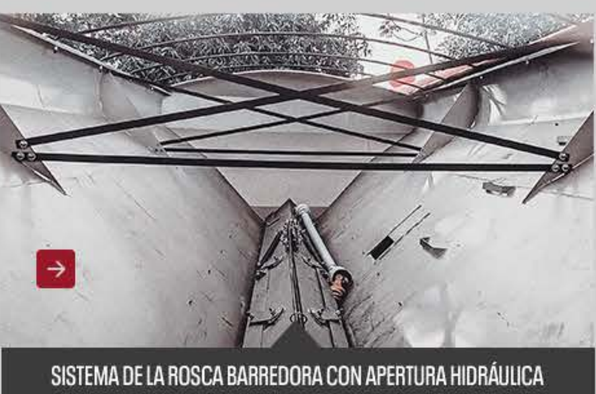
SISTEMA DE LA ROSCA BARRIDORA CON APERTURA HIDRÁULICA