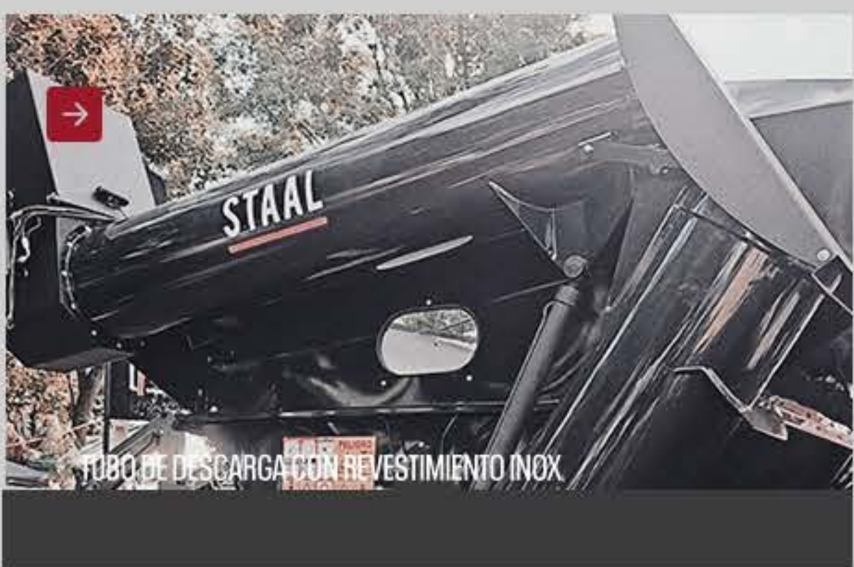
TUBO DE DESCARGA CON REVESTIMIENTO INOX

Experimenta la combinación perfecta de tecnología y durabilidad para su operación agrícola, con STAAL® .