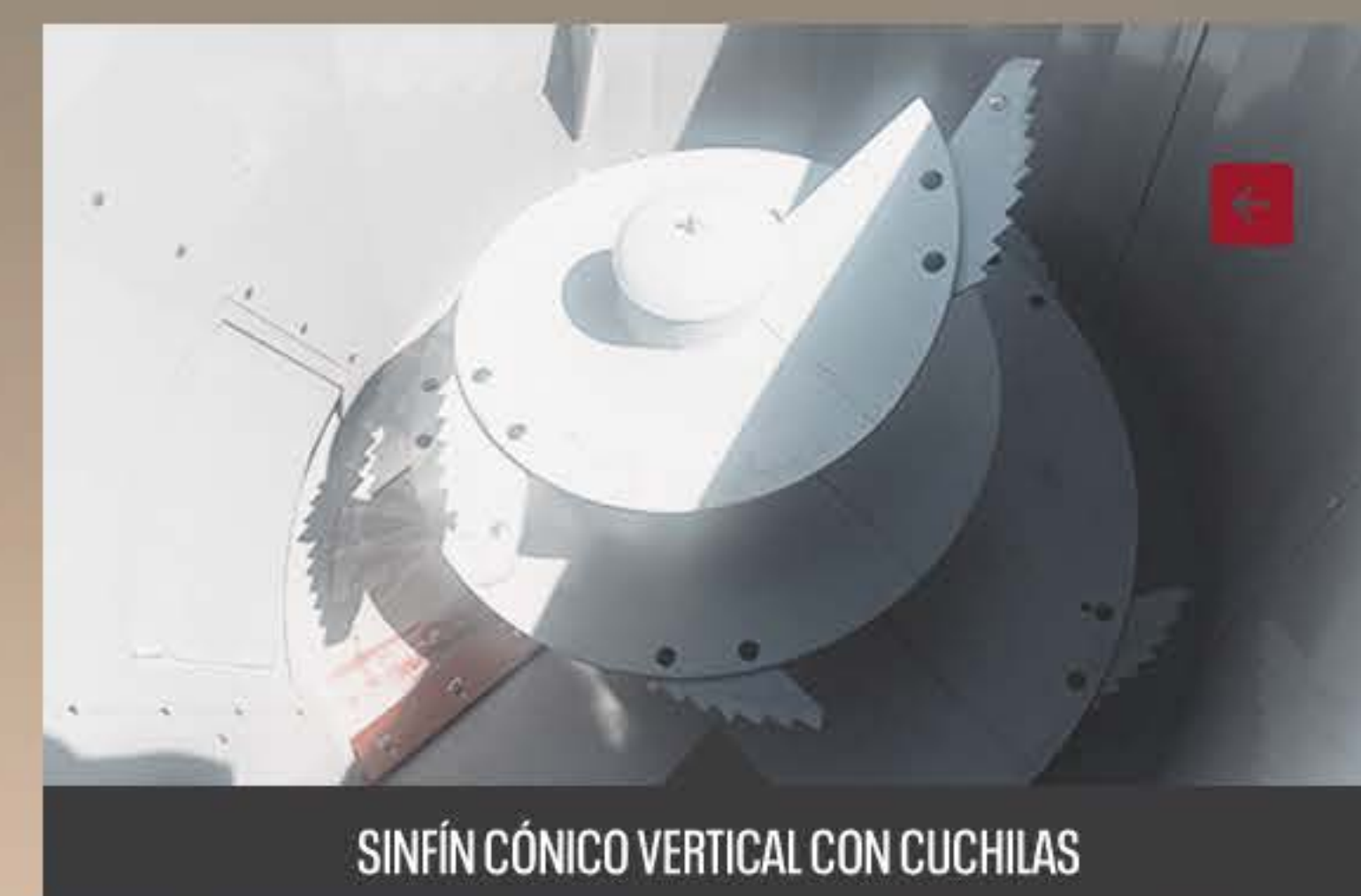
SINFÍN CÓNICO VERTICAL CON CUCHILAS