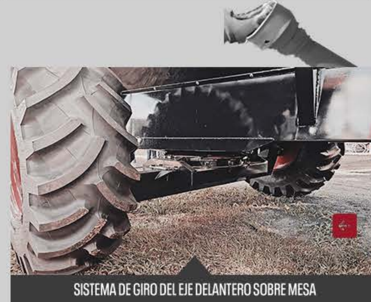
SISTEMA DE GIRO DEL EJE DELANTERO SOBRE MESA