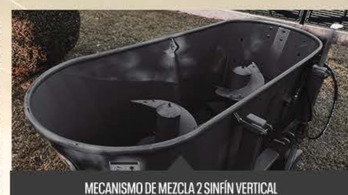
MECANISMO DE MEZCLA 2 SINFIN VERTICAL