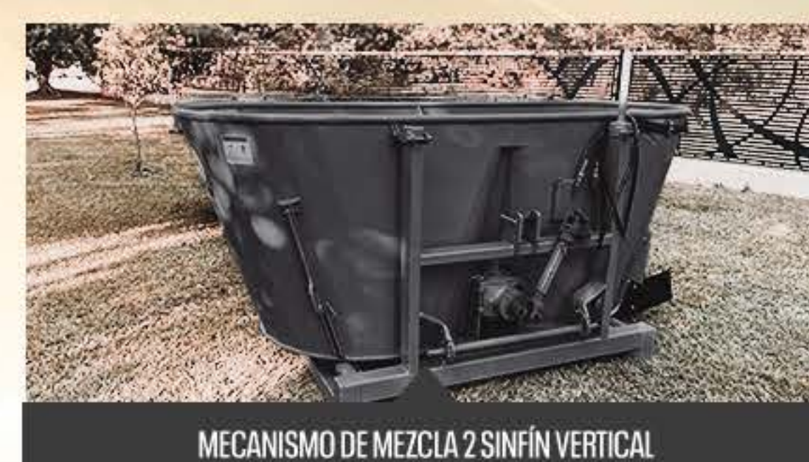
MECANISMO DE MEZCLA 2 SINFIN VERTICAL