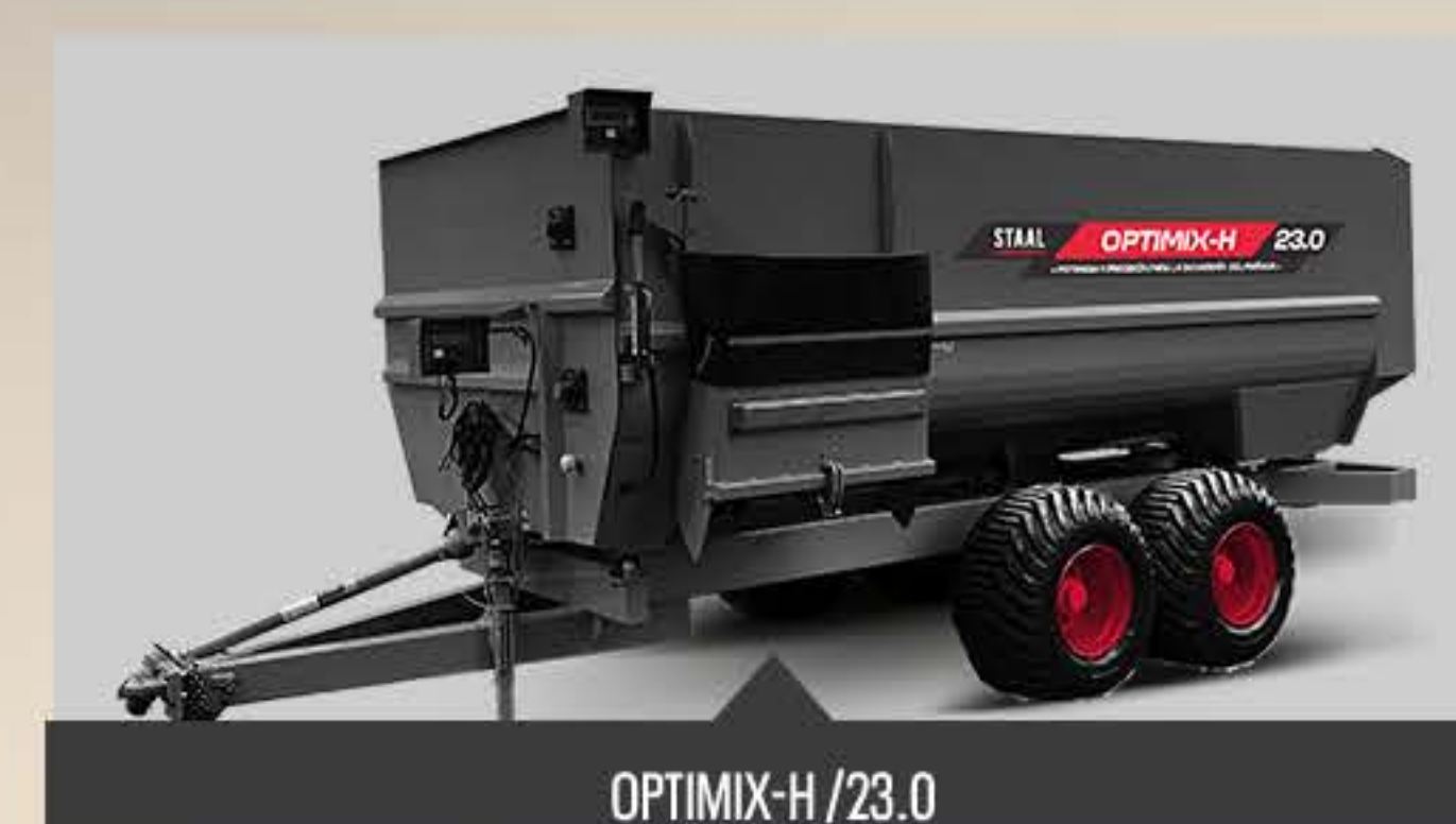
OPTIMIX-H / 23.0